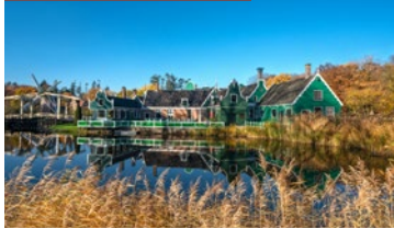
DER NATIONALPARK DE HOGE VELUWE